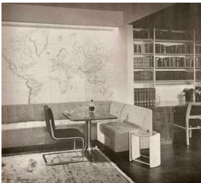
1930. aastate modernistlik interjäär